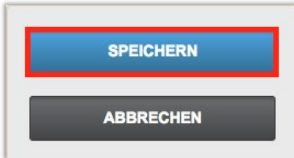
Abbildung 5 – Speichern der Eingaben

Stellen Sie sicher, dass Sie nach Abschluss der Bewertung alle Informationen speichern (siehe Abbildung 5).