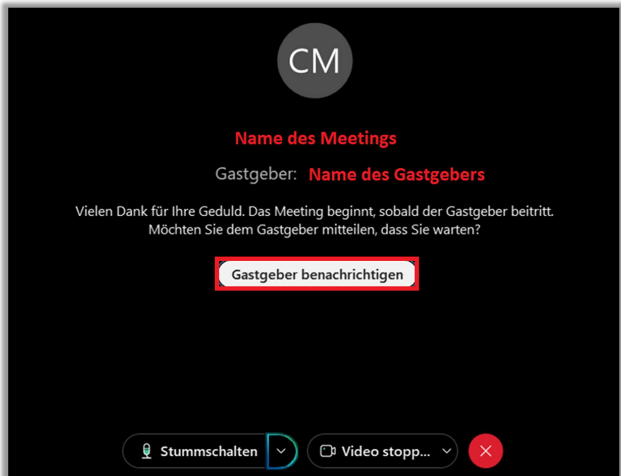
Abbildung 5 - Gastgeber benachrichtigen

Das Webex-Meeting-Fenster wird geöffnet. Sollte sich wie in unserem Beispiel der Gastgeber noch nicht in dem Meeting eingewählt haben, können Sie ihn/sie über den Button „Gastgeber benachrichtigen“ informieren (siehe Abbildung 5).