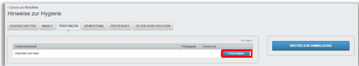
Abbildung 2 – Hinzufügen einer Prüfung

Klicken Sie neben der gewünschten Lektion/Unterrichtseinheit auf die Schaltfläche „+ Hinzufügen“ (siehe Abbildung 2).