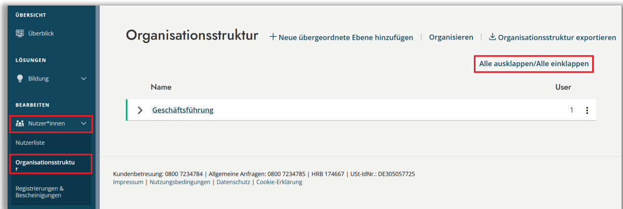
Abbildung 1 – Organisationsstruktur ausklappen

Wählen Sie die gewünschte Ebene aus. In der Übersicht der User finden Sie in der rechten Spalte „Benachrichtigungen“ bei den Führungskräften die Möglichkeit, über einen Schalter festzulegen, ob eine Führungskraft als Benachrichtigungsempfänger*in aktiviert oder deaktiviert werden soll (siehe Abbildung 2).