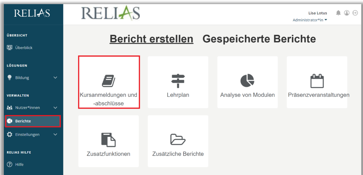
Abbildung 1 –Kategorien der Berichte

Um den Bericht „Unterrichtsstunden“ zu erstellen, melden Sie sich zunächst auf der Relias Plattform an und wählen den Menüpunkt „Berichte“ aus. Wählen Sie anschließend die Kategorie „Kursanmeldungen und -abschlüsse“ aus (siehe Abbildung 1).