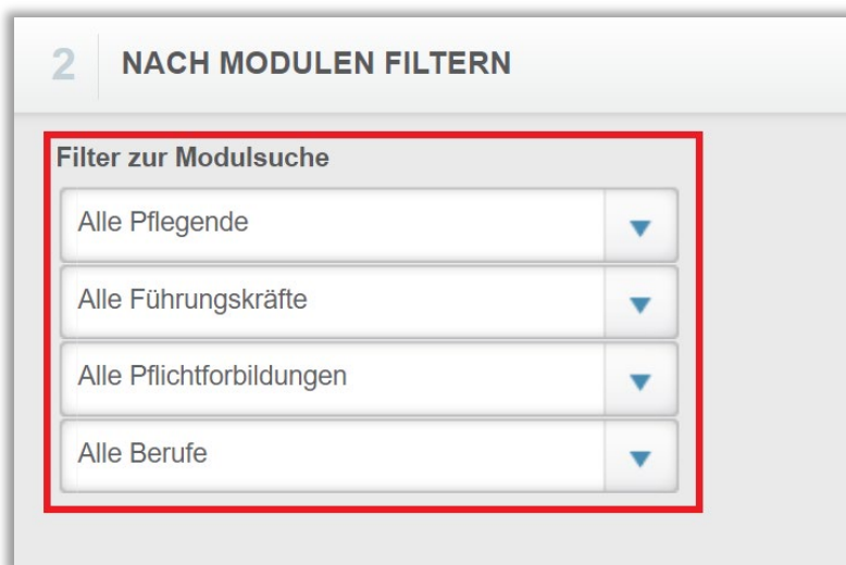
Abbildung 4 - Nach Modulen filtern

Bitte beachten Sie: In diesem Abschnitt sind nur Filtermöglichkeiten vorhanden, wenn Sie unter dem Menüpunkt „Filter zur Kurssuche“ eigene Filter erstellt haben. Nähere Informationen dazu finden Sie in der zugehörigen Anleitung „Filter zur Kurssuche“. Ansonsten werden standardmäßig alle Module ausgewählt.