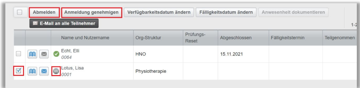
Abbildung 3 – Anmeldung genehmigen / Abmelden

Die Lernenden sind nun je nach Auswahl der Veranstaltung hinzugefügt oder abgemeldet und werden im Anschluss per E-Mail über den jeweiligen Status informiert (Voraussetzung: eine gültige E-Mail-Adresse ist im jeweiligen Lernenden- Profil hinterlegt).