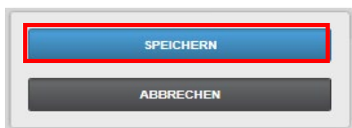
Abbildung 9 – Abspeichern der Daten

Abschließend klicken Sie auf „Speichern“ (siehe Abbildung 9).