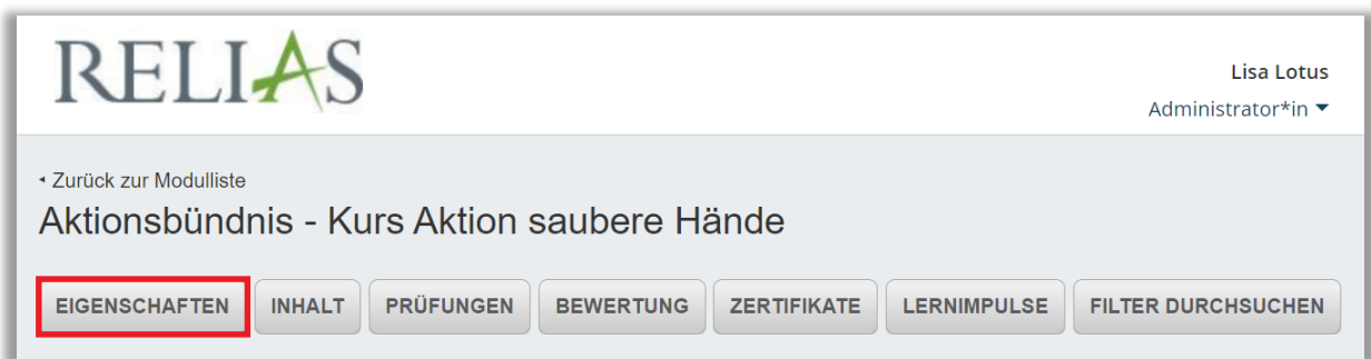
Abbildung 2 - Eigenschaften

Gehen Sie anschließend in der oberen Menüleiste in den Bereich „Eigenschaften“ (siehe Abbildung 2).