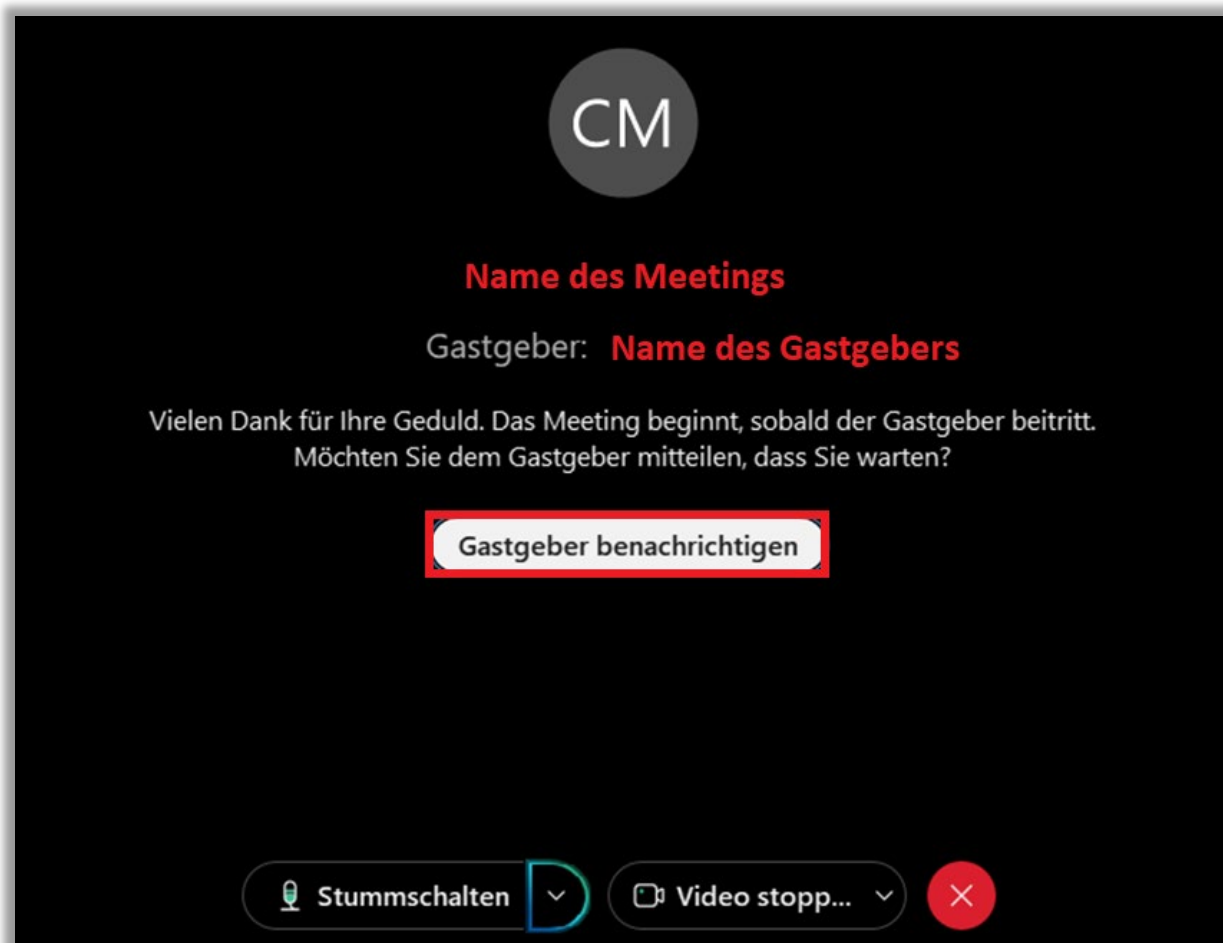
Abbildung 5 - Gastgeber benachrichtigen

Das Webex-Meeting-Fenster wird geöffnet. Sollte sich wie in unserem Beispiel der Gastgeber noch nicht in dem Meeting eingewählt haben, können Sie ihn/sie über den Button „ Gastgeber benachrichtigen “ informieren (siehe Abbildung 5).