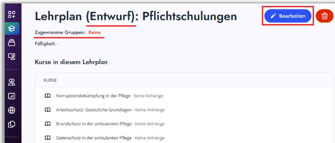
Abbildung 2 – Lehrplan bearbeiten

Bitte beachten Sie: Ein Lehrplan kann erst dann veröffentlicht werden, wenn ihm mindestens eine User-Gruppe zugewiesen wurde. Andernfalls bleibt er im Status „Entwurf“ (siehe Abbildung 2).